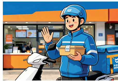
外卖配送落实“食安封签”管理。

记者在多日走访调查中发现，目前各商家的封装封签标准不一。有部分商家为外卖加上双份“安全保障”，例如一家咖啡店除外包装袋贴封外，袋内咖啡杯杯身还交叉粘贴了食安封签；