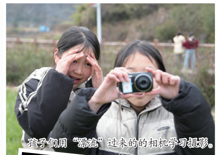
孩子们用“漂流”过来的相机学习摄影。

有一次，一家公司寄来了运动相机，让孩子们带回家拍——他们在课间拍同学追逐打闹的瞬间，在家里拍爷爷奶奶坐在门槛上晒太阳的样子，拍小狗追着自己的尾巴转圈。这些稚嫩却真诚的作品，被打印出来并贴在学校的展板上。从那一刻起，孩子们的作品不再是手机相册里沉睡的数据，而成了被郑重对待的“艺术品”。