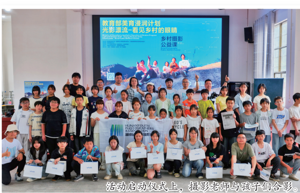
活动启动仪式上，摄影老师与孩子们合影。

个公益项目给予了全力支持。这位在教育一线坚守多年的基层管理者比谁都清楚乡村孩子最缺什么——不是补课更不是说教，而是一份来自外界的郑重注视。