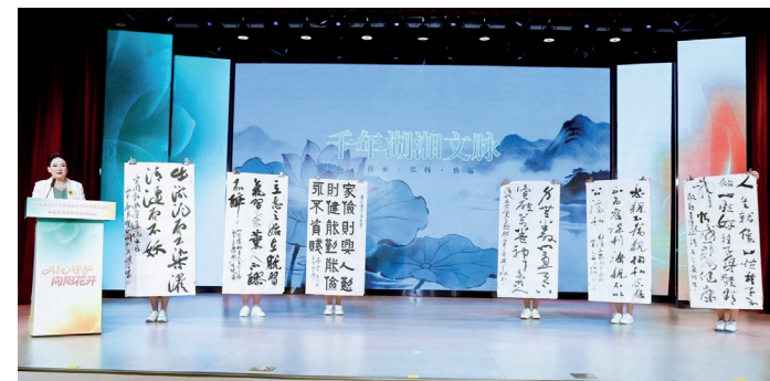
活动现场，展示6位全国知名书法家联袂共创的家风主题书法作品。

本次活动由湖南省妇联主办，湖南省家庭教育研究会、今日女报/凤网、湖南省妇女儿童活动中心承办，湖南省广播电视台、湖南女子学院、湖南省演艺集团协办，中国妇女杂志社特别支持。