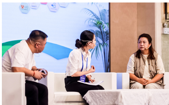
模拟调解环节，调解员用心用情与“夫妻”双方沟通。

据了解，此次模拟调解的案例原型全部精心挑选自人民调解案例库，紧贴社会现实，特别强调选手们对家庭亲情与婚姻的挽救，更好地促进社会和谐稳定、婚姻家庭幸福。