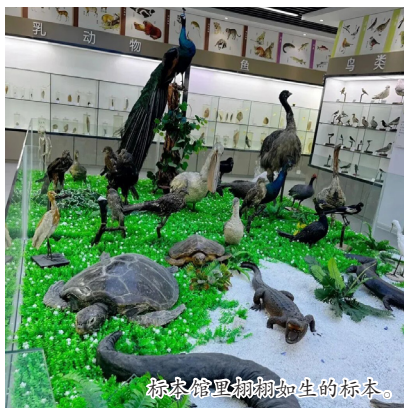
标本馆里栩栩如生标本。

如果逛完学校还意犹未尽，周边还有隆平水稻博物馆、湖南省茶叶博物馆、东驿体育公园、柳子明故居、圆点美术馆等好去处适合亲子打卡。