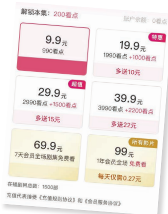
某微短剧小程序付费页面。