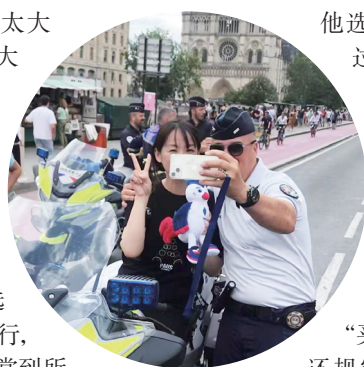
中国游客和巴黎的警察合影。

但其实,除了镜头拍到的部分,镜头之外,塞纳河边的演出不断,“塞纳河成为了一个大型的剧院,河两岸都十分热闹”。李奥的邻居在塞纳河边的一家公司上班,开幕式举行时,