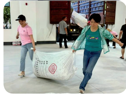
岳阳市妇联、市女企业家协会送来捐助物资。

当日晚上，援助车辆抵达华容县，岳阳市妇联领导及市女企业家协会企业家代表们纷纷帮忙卸货，力求以最快速度把物资送到百姓手中，价值24万元的5340床空调被全部卸货清点完成。