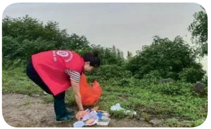
暴雨过境，营田镇巾帼党员清点和搬送防汛物资、排查险情隐患。

在屈原管理区，凤凰乡巾帼志愿者们与各级防汛人员一起投身防汛一线，在风雨中做好劝说切坡建房户及时转移、走访困境妇女儿童、24小时值班值守、冒雨在大堤上巡查水位、清扫洪水冲上来的漂浮垃圾等防汛工作。