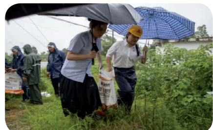
鹤龙湖镇妇联组织广大妇女干部、妇联执委和巾帼志愿者开展巡堤查险、值班值守、生产自救。

近日，湘阴县各级妇联组织充分发挥表率作用，组织广大妇女干部、妇联执委和巾帼志愿者积极投身防汛一线开展巡堤查险、值班值守、生产自救等工作。