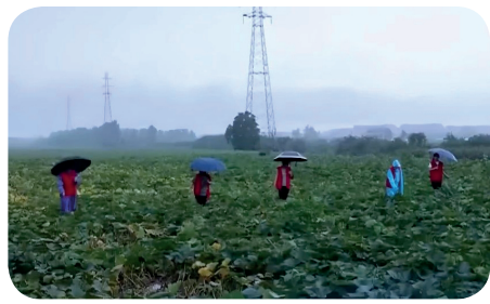
濠河村的“娘子军”沿着堤边坡段仔细巡查，判断堤岸是否存在渗水、管涌等情况。

在君山区，柳林洲街道濠河村积极号召村民，成立了一支特殊的“防汛娘子军”，巡防堤坝、日夜值守。