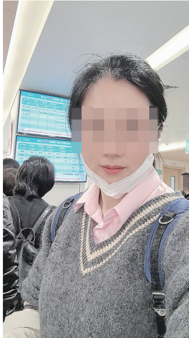
大美在帮客户取药。

有一段时间，大美将自己一天的陪诊经历做成视频发到网络平台上，同时，也会科普一些疾病相关的小知识。但很快，她这些视频都被平