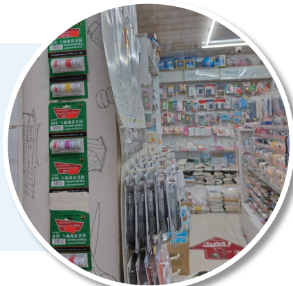
长沙某中学门口的文具店里,左边两竖排的“鼻吸能量棒”已售出近半。

轻轻一吸,提神醒脑。近日,继“萝卜刀”之后,一种“鼻吸能量棒”又在中小學生之间火了起来,随即也引起了很多家长的担心。这种声称有“提神醒脑”功效的能量棒,真的像商家宣传的那样无毒无害吗?小孩使用后是否会上瘾呢?近日,今日女报/凤网记者进行了探访。