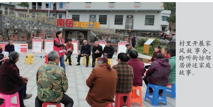
村里开展家风故事会，聆听街坊邻居讲述家庭故事。

言传与身教并行是南岳村家风教育的一个亮点，修民约、清乡风、搞评比，让村民们在传承好家风上更有活力了。