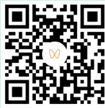
扫一扫，看精彩视频

“我的人生因钢琴而反转，我想用一场场音乐会告诉我一样的残障孤儿，你们也能站在属于自己的舞台！”这一刻，观众席里，有人悄悄落泪，有人欢呼鼓掌。