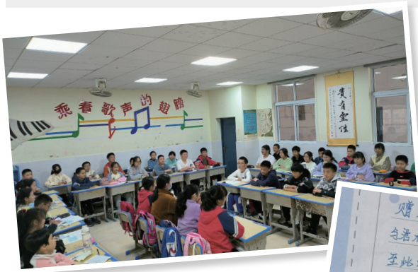
泉星小学58班对对子大比拼现场。

又到毕业季，小学生们除了拍各种“花式”毕业照，还能玩出哪些新花样？在长沙县泉星小学58班，同学用对联写下对老师、同学的毕业赠言，成为一道独特的风景；在长沙市育才小学1703班，一部小学生自制的《1703纪念录》短片，成为了大家最珍贵的回忆……近日，今日女报/凤凰网记者走近这群长沙小学生，聆听他们的“花样”毕业故事。