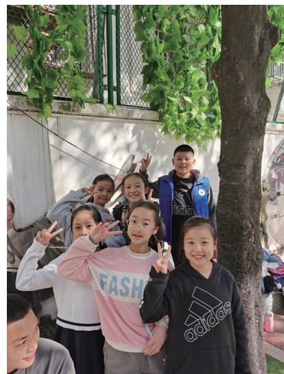
同学一起拍摄毕业短片留影。

为了制作这短短6分钟的视频，女儿着实花费了不少精力，“有时候看她剪辑视频到深夜，为了选出一个最合适的配乐试听几十遍。我问过为什么她在视频里面采访了很多同学，自己却一秒都没有出境，她没有正面回答我，只是说自己很享受记录大家的过程”。