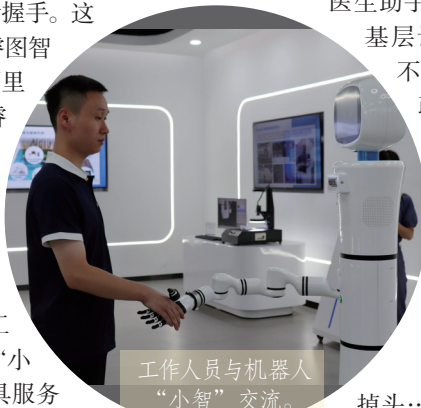
工作人员与机器人“小智”交流。

的十年，我们实现了从软件服务到软硬一体化，从应用软件到基础软件的重要发展跨越。我们的目标也是在未来十年，打造中国软硬一体化行业第一。”李新宇表示，第一次参与岳麓峰会的12家企业已经全部上市，越来越多的互联网企业把第二总部、区域总部和研发中心设立到长沙，越来越多的企业在长沙得到了非常好的发展。