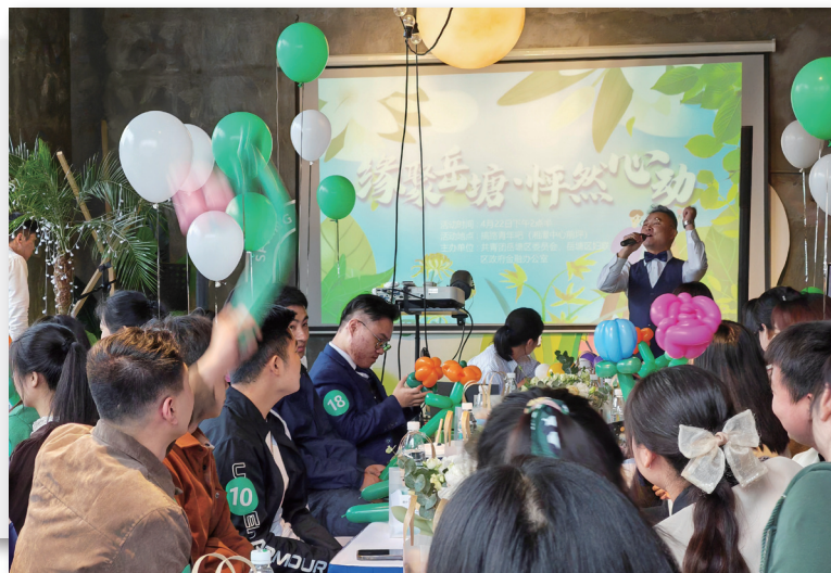
相亲现场，嘉宾们游戏互动。