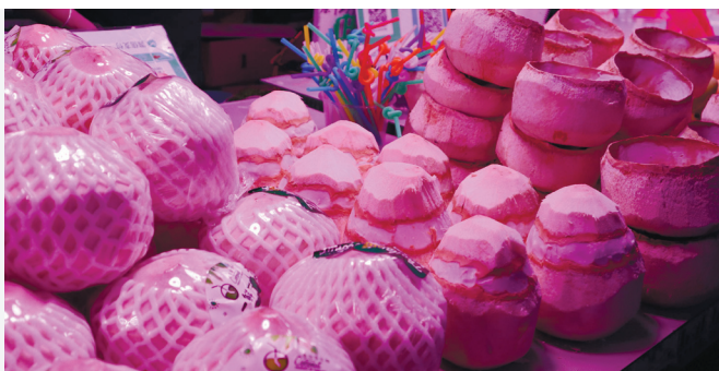
预开口椰子带来方便的同时也有一定的安全隐患。

可是，你知道吗？预开口的椰子水容易变质，甚至有人喝了变质的椰子水进了医院。那么，怎样辨别椰子水是否变质？不小心喝了变质的椰子水又该怎样处理呢？