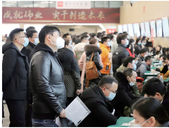
长沙大型招聘会,毕业生带着简历推销自己。

究生 499 人,占毕业生总人数 9.61%;本科生 4632 人,占毕业生总人数 89.18%。“尽管近五年来,学校研究生招生规模都在扩大,但并未出现硕博反超本科的现象。”