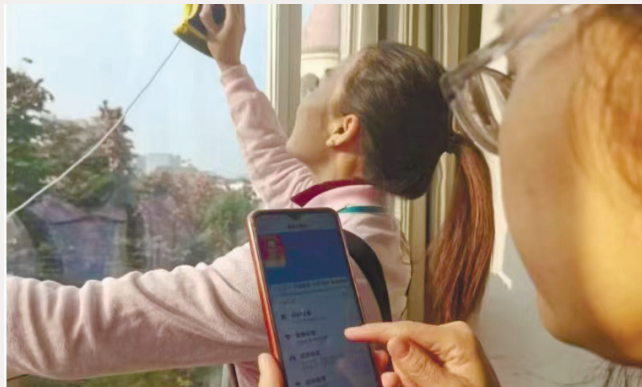
扫一扫家政诚信上岗卡的二维码,家政人员的从业信息一目了然。

据不完全统计,近三年来,郴州市家庭服务行业协会已累计向粤港澳大湾区输出家政服务人员达4.2万人次,郴州打造的“福城月嫂”“福城工匠”“福城银嫂”“福运到家”等一系列“福”字号家政服务劳务品牌,成了大湾区家政服务行业的“香饽饽”。