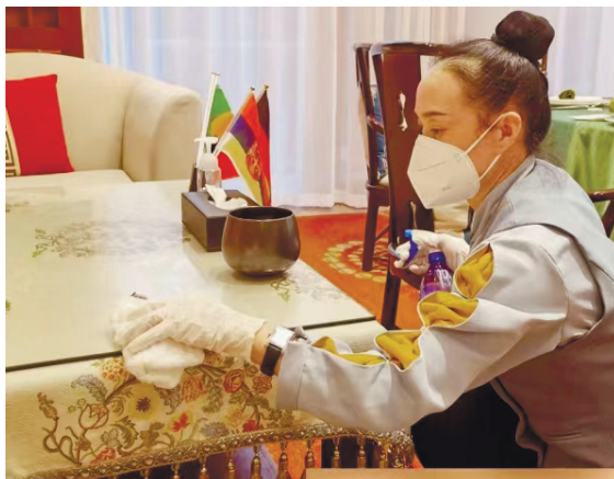
酒店工作人员会在阳性客人退房后进行消杀。

“最重要的是，现在有医护人员一天24小时值班，为阳性客人提供健康服务。”另外一个位于郴州市苏仙区的“康复之家”苏园宾馆的工作人员告诉记者：“从前有很多阳性客人打电话来问能不能到酒店来自我隔离，我们担心自己的防疫措施不够完善，不敢接收。现在有了政府帮助，我们酒店的防疫条件得到