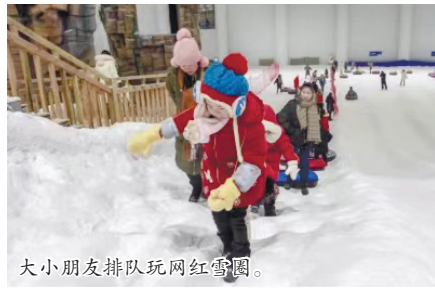
大小朋友排队玩网红雪圈。

南方孩子总有一颗想玩雪的心，尤其随着冬奥会在我国的成功举办，冰雪运动逐渐成为不少家庭冬日亲子游的新选项。