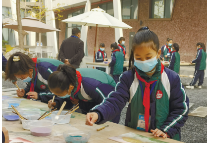
很多孩子来体验砂石画。

2001年，他们创办了湖南省首批文化产业示范基地、国家AAA级旅游景区“军声画院”。