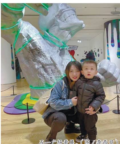
五一广场看展。