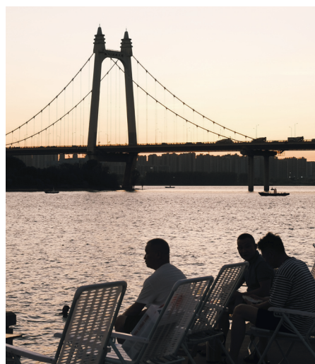
三汉矶大桥的黄昏。

“到底是谁发现的这块宝藏地？可以说是我的年度最佳。”李女士的宝宝才2岁，正是对外界感兴趣的年纪，她告诉记者：“平时会在小区里逛一逛，天气好一定会来这边。从某些角度看，真的很有海滨城市的感觉。”李女士说，开阔舒适的江面能更好地舒缓自己带孩子的疲劳情