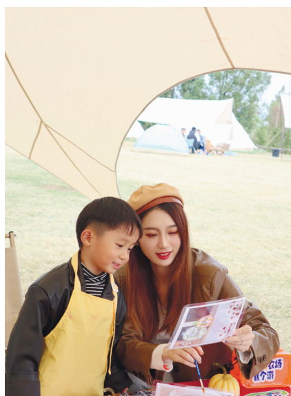
巴溪洲露营。

而相比巴溪洲已经完全开发的状态，鹅洲岛与兴马洲则为市民、游客提供了更为原生态的露营体验。“鹅洲岛有大片白色的沙滩，有灯塔，现场很有看海的感觉，岛上还有专门打造的露营基地，可以停房车、扎帐篷。”毛女士向记者娓娓道来，“兴马洲是一个独立在湘江的美丽村落，带孩子去这里的农家乐玩过，岛上有稻田、树林，也有灯塔，路上可以看到山羊，最特