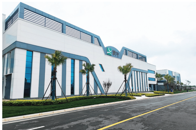
蒙牛曲靖工厂 2021 年度绿色用电比例达到 88.68%，实现智能制造、绿色制造。

在供应链端，蒙牛采购的近 200 亿包材原纸通过 FSC 森林体系认证；100% 棕榈油采购自通过 RSPO 认证的供应商，同时蒙牛还尝试采用可再生材料，全面应用 PCR 作为产品外包装薄膜，PCR 再生材料含量达到 13%~24%，提高包装的再利用率。