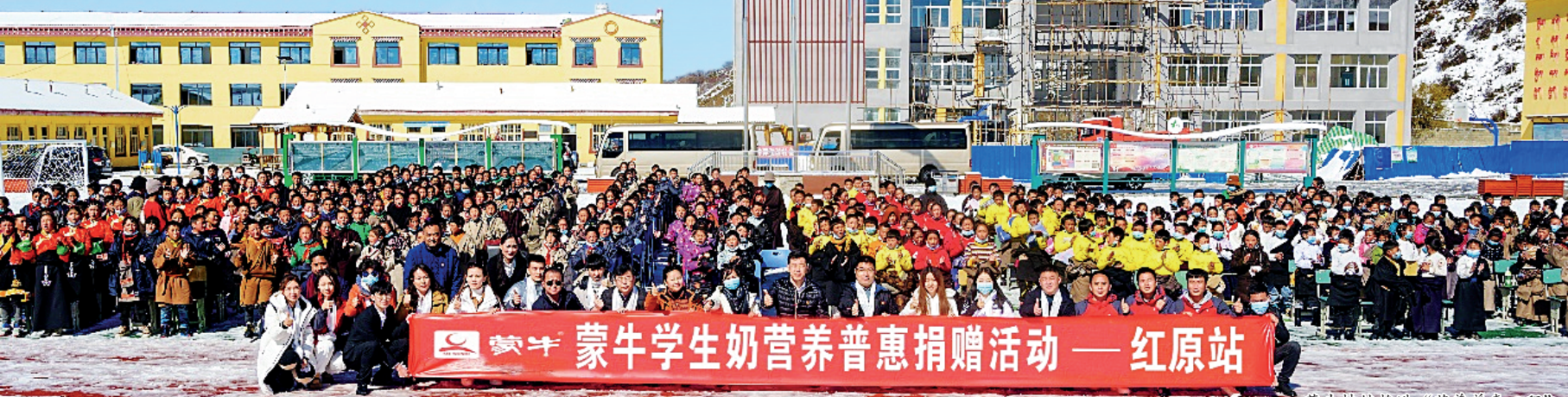
蒙牛持续推进“营养普惠工程”。

环境、社会和公司治理又称为 ESG (Environment, Social and Governance)，从环境、社会和公司治理三个维度评估企业经营的可持续性以及对社会价值观念的影响。