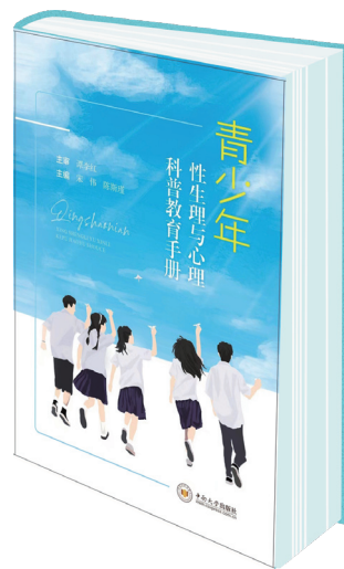
《青少年性生理与心理科普教育手册》出版。

孩子们的心理健康。许多家长忽视了孩子在青春期时的心理健康，自己也缺乏相应的知识。”除了身体上的生长发育，这时期的男、女孩在心理上也在经历着激烈的变化。“抑郁作为如今青少年突出的心理问题，相较于成年人抑郁症症状更多样，表现更复杂，因此和青春期生理变化问题一样需要我们给予关注。”