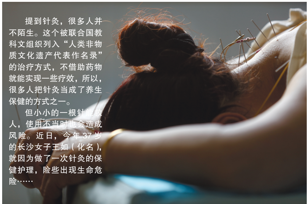
如今, 针灸已经成为很多人养生保健的方式之一。