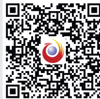
扫一扫,分享新农人传奇