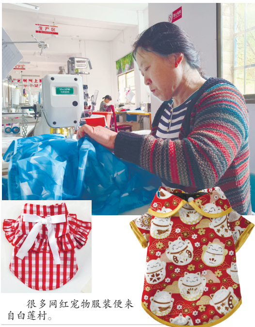
很多网红宠物服装便来自白莲村。

虽然大家工作的热情高,但大家技术不熟练,生产出来的宠物服装面临着大量的返工。“除了两名有30年缝纫经验的妇女,大多数