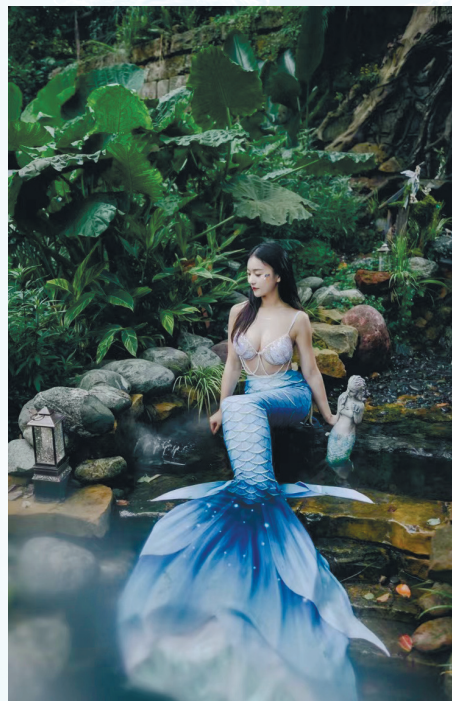
周迅的美人鱼照片总是能在朋友圈吸引很多赞。