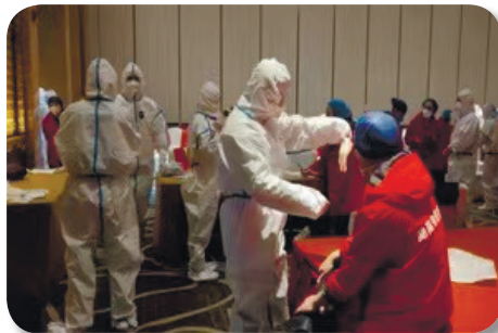
队员们在进行穿脱防护服的考核。

今天是到上海支援的第三天，一切都安顿下来了，来上海原本有些紧张与担心的我，这几天看到如此团结的中医附二人，紧张的心情瞬间得到了缓解。从院领导到每一位普通的同事都在积极努力地解决问题：我院医护人员多次进入方舱医院实地