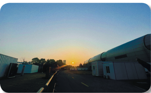
上海凤凰实验室外。

队员从不熟悉工作流程到现在分工明确，通力合作，互相配合，越来越默契，有了相当不错的“战绩”：我们从第一个工作日完成3000管的工作，到第二个工作日的8000管，再到第三个工作日的12000管，成效与日俱增。更值得称道的是，工作量再大，也没有任何队员叫苦叫累！