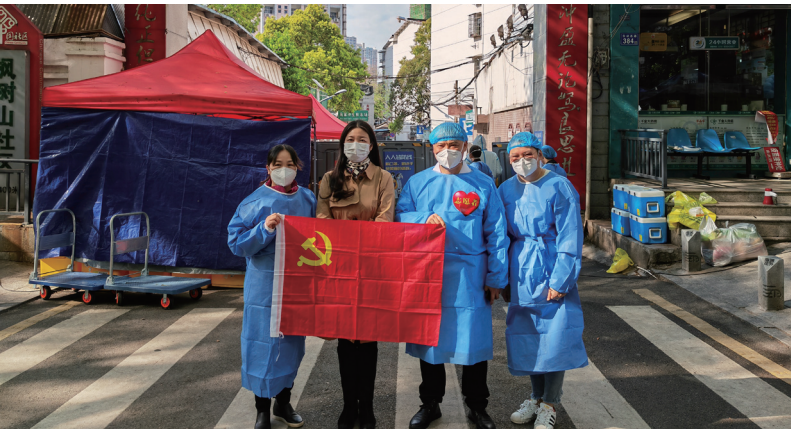
黄金（左二）和枫树山社区的工作人员坚守一线。