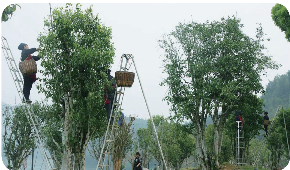
在古茶树上采茶是勇敢者的游戏。