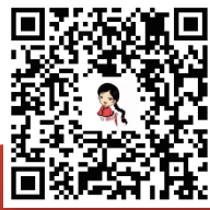
扫一扫，转发倡议书。