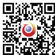
扫一扫,看救人惊险场景。

湖边群策群力时,当所有平凡人在一个平凡的时刻做出不平凡的举动时,凡人的爱心微光已然汇聚成最热烈的温暖。