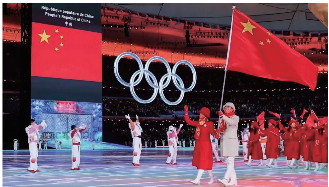
2月4日，北京冬奥会开幕式，中国队入场。

当我们欣赏各国冰雪健儿的奋进拼搏之姿，为祖国的荣耀欢呼呐喊，为开幕式惊艳点赞时，你可能还没发现冬奥会上的许多湖南元素，一起去看看这些如虎添翼的冬奥“湘”味吧。