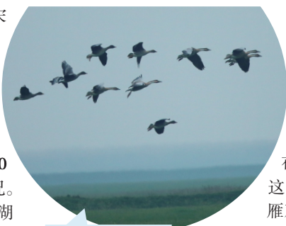
大雁原来是忠贞爱情的代言人。