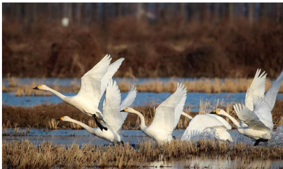
天鹅, 只可远观。

蓬松的羽冠, 并且羽毛都呈现鳞状。有人形容它是头梳直立奔放“发型”, 身穿鱼鳞斑纹“马甲”。目前, 它的数量并不多, 全球只有几千只。在黑龙江省伊春带岭北部20公里处就有一处省级中华秋沙鸭自然保护区。而且, 很多人不知道的是, 潜水捕食鱼类的中华秋沙鸭经常成对或以家庭为群出现。你们这么喜欢抱团, 周边的游客知道吗?