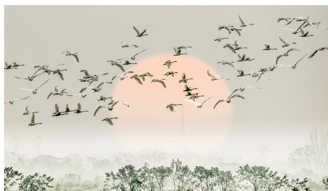
去洞庭湖观候鸟是很爱鸟人士的共同选择。

白枕鹤、白鹤等各类国家珍稀保护鸟类分布在洲滩和湖面。此起彼伏的鸟鸣声, 让寒冷的冬天焕发着勃勃生机。