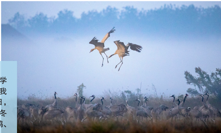
今年, 在湖南越冬的候鸟超过20万只。