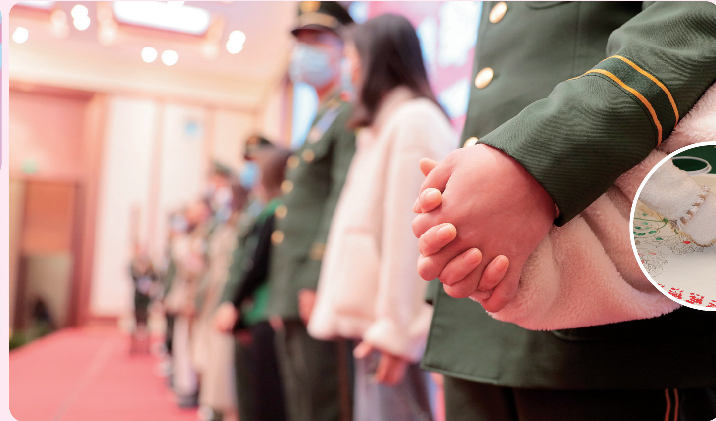
祝福！26对青年在活动现场成功牵手。