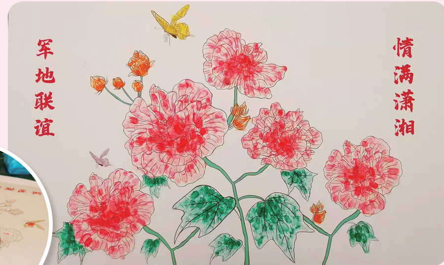
你按下绿色手印，我按下红色手印，兵哥哥和湘妹子共同完成了一幅“军地联谊 情满潇湘”的芙蓉花手印图。