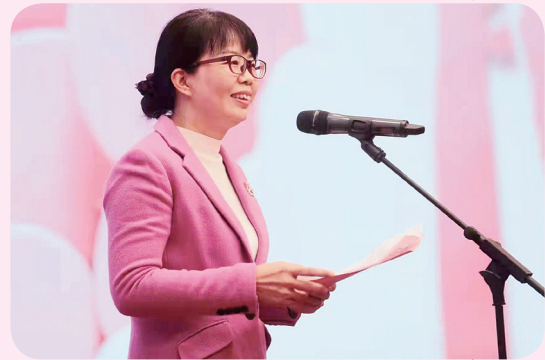
湖南省妇联党组书记、主席黄芳致辞。

当红妆邂逅了军装，当浪漫增添了迷彩的颜色，爱情会碰撞出多少新的火花？在长沙举行的这场军地联谊活动为你揭晓了答案。