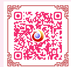
扫一扫，看更多精彩瞬间。

这场联谊活动有多热？今日女报/凤网全媒体推出的活动相关报道，在抖音，话题“爱在军营情满潇湘”播放量超过3亿，点赞数超过60万。微博话题“第三届湖南武警军地联谊”“100对兵哥哥与湘妹子浪漫邂逅”分别登上新浪微博同城榜第10名和第4名。一场温暖的活动，助推军地青年建立纯洁、真挚的情谊，成就了美满佳缘。