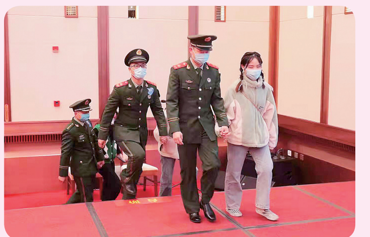
剪“囍”字、编织戒指、蒙眼识香……在合作体验非遗技艺中，一颗颗火热的心一步步靠近，更有人牵手上台分享喜悦。