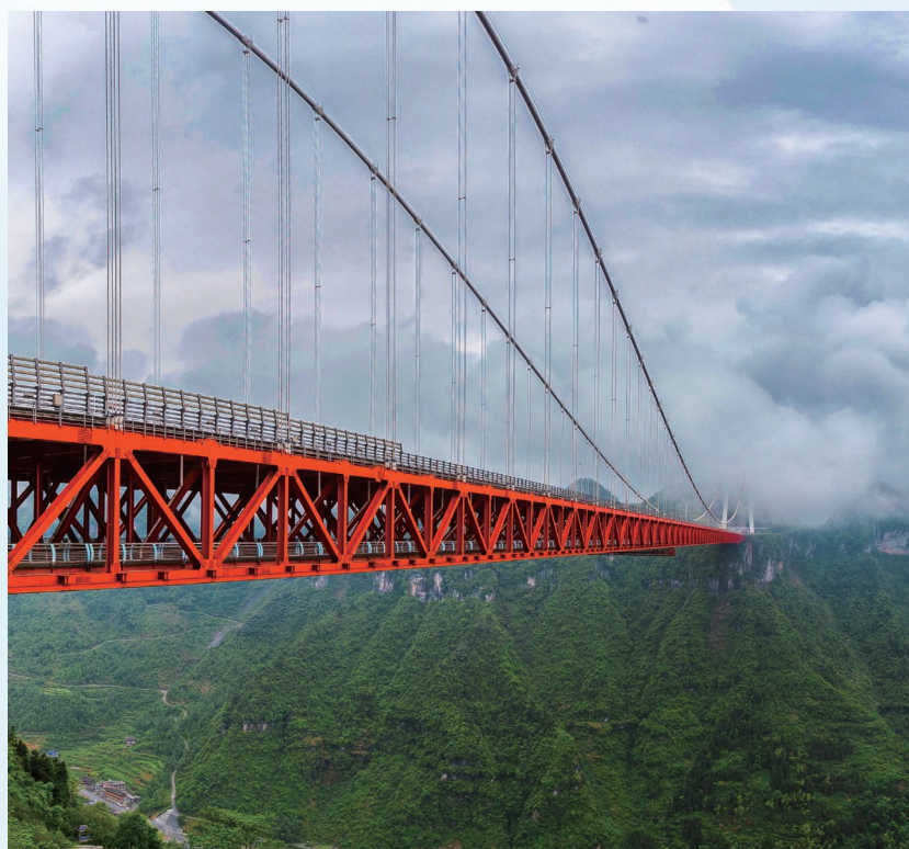
一桥飞架东西，天堑变通途。

在湖南，就有这样一些创造吉尼斯世界纪录的景点，被称为“湖南之巅”，成为人们争相打卡的地点。一起去看看吧！