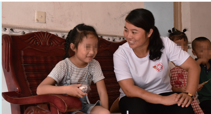
执委妈妈和结对的孩子亲密交谈。

如今，距离执委妈妈看护队这一工作正式实施已经过去了一段时间，这些妇联执委们对自己的新身份适应得如何，孩子们又有什么改变呢？