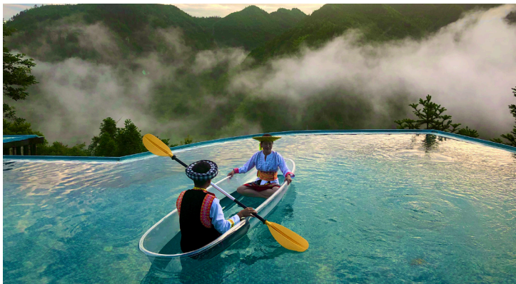
无边浴场还能泛舟。

中秋佳节，对于习惯了珍馐美饌、腻歪了江边烟火的你来说，或许走进乡村，大山里藏着的一片“无边风月”，会让你眼前一亮。深藏在邵阳市隆回县的大花瑶景区内便有一处难得的“美景”。