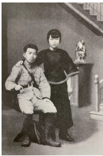
1927年陈毅安与李志强合影。

几天后，李志强生下一个大胖小子，她给孩子取名“陈晃明”，希望孩子和一家人“一晃就能见到光明的一天”。