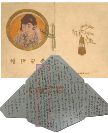
↑ 1922年元旦，陈斌（毅安）给佩勋寄来英文贺卡。 ↓ 1927年陈毅安寄给李志强的信。

1927年夏，陈毅安随北伐部队到达武昌，被任命为国民革命军第2方面军总指挥部警卫团辎重队队长。警卫团是一支由共产党掌握的正规军队。这一年，蒋介石和汪精卫相继发动“4.12”政变和“7.15”政变，国共关系破裂，国