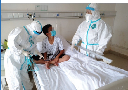
长沙市第一医院医护人员照护患者。

无症状及轻症、普通型病例不主张应用激素；对于进展快、症状重、影像学改变明显的患者和重症患者可考虑使用小剂量激素，可有效减少病情恶化的发生。重症病例可使用恢复期患者血浆、丙种免疫球蛋白、妥珠单抗等药物，但疗效不确切。在儿童重症病例中推荐使用丙种球蛋白治疗。