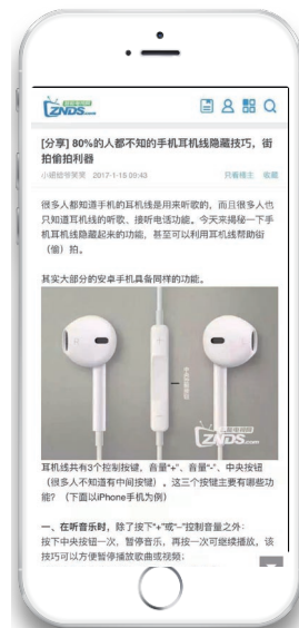
网上流传的“手机耳机线变偷拍神器的技巧”。