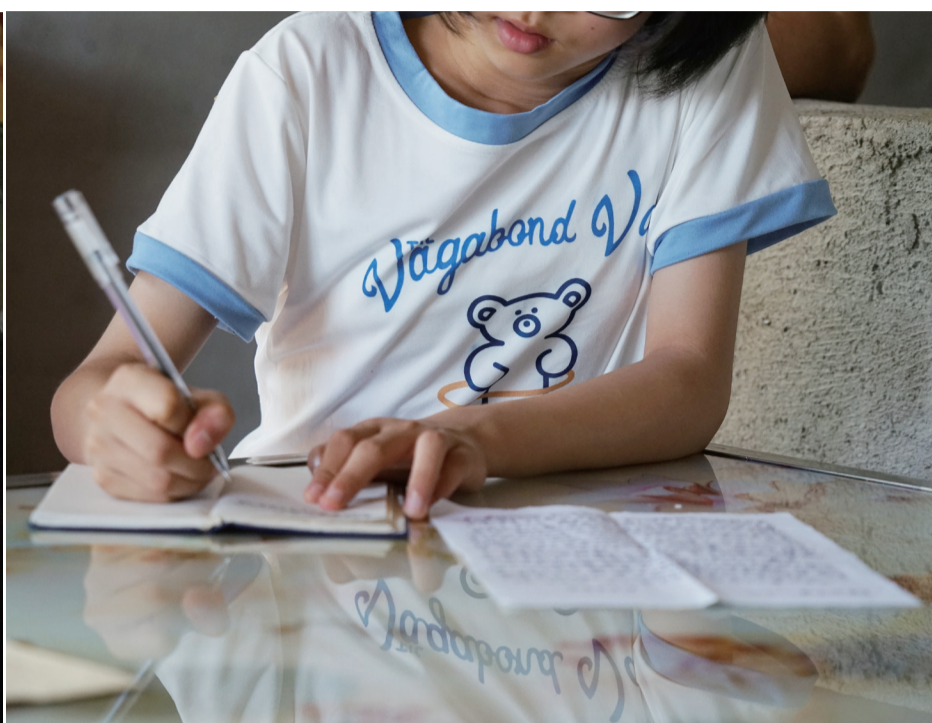
收到高墙里爸爸的信, 9岁小女孩给爸爸回信。