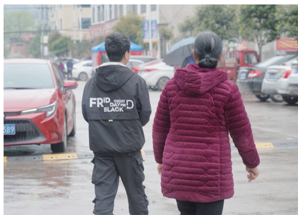
一名服刑人员的儿子在奶奶的护送下上学。