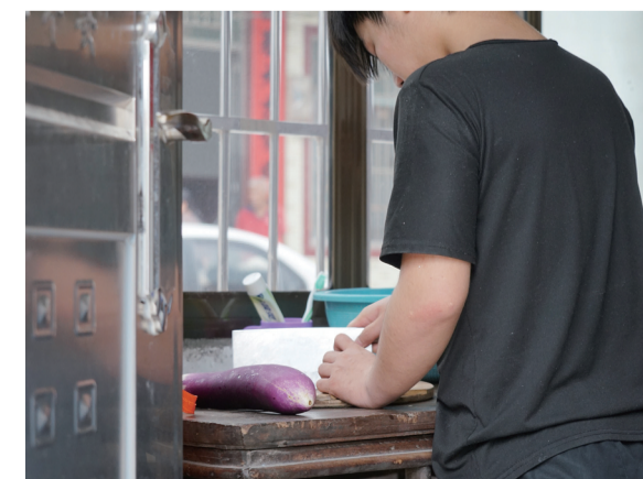
父亲入狱, 母亲出走, 已是事实孤儿的孩子早早当了家。