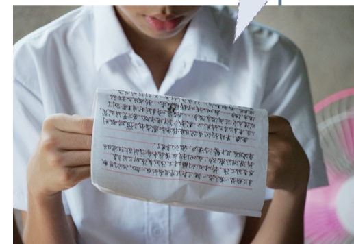
男孩把来自爸爸的信读给妈妈听。