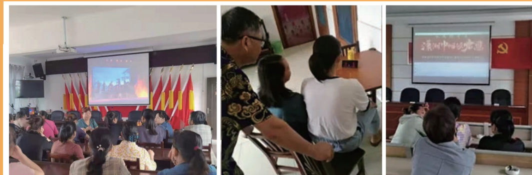
全省各地妇女群众通过多种方式线上收看晚会。