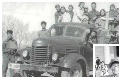
1954年，入疆湘籍女兵们去农场劳动。

她们的故事经由今日女报全媒体报道后，网友纷纷点赞留言，表示她们是“奉献的一代人”、“向前辈致敬、为湘人自豪”。