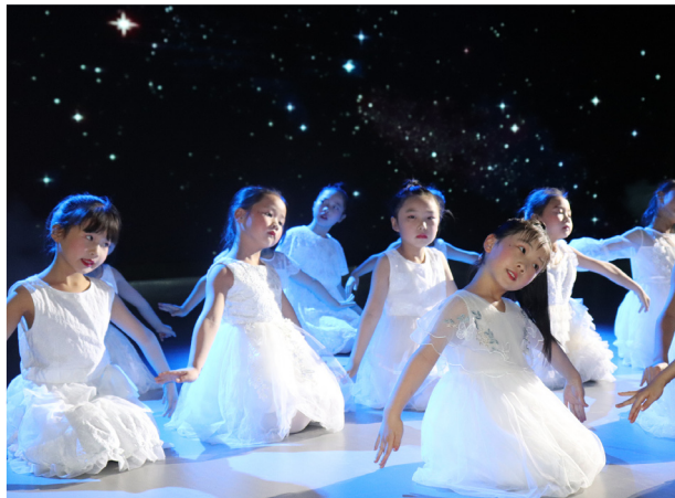
《妈妈教我一首歌》歌舞