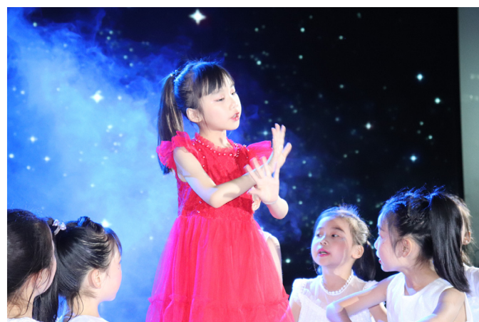
《妈妈教我一首歌》歌舞