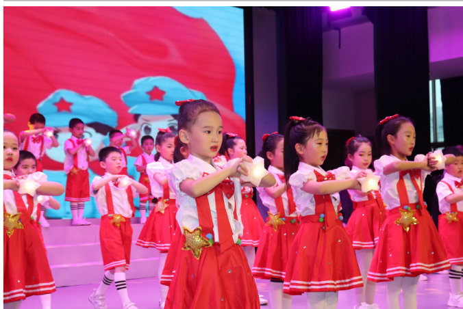
《谁有我们和党亲》合唱