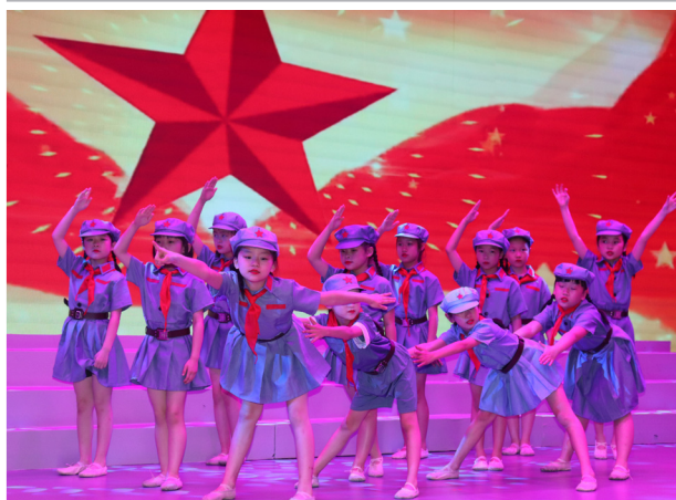
《烽火硝烟》舞蹈串烧