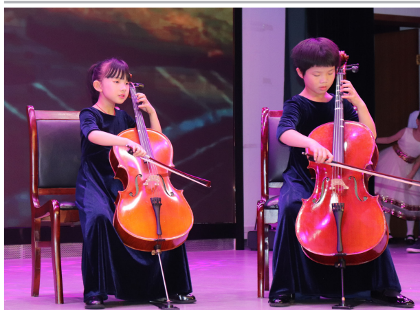
《我和我的祖国》大提琴齐奏