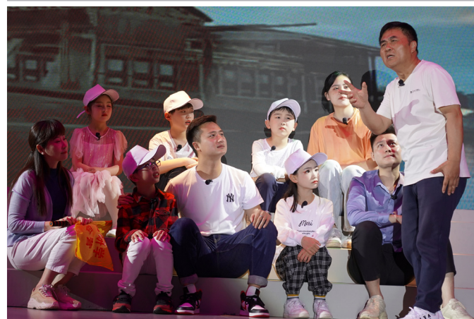
《红船精神》情景表演