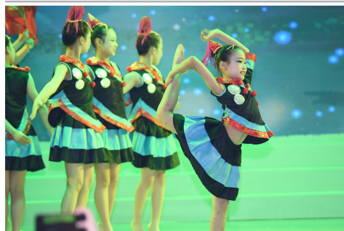
《七彩童谣》民族舞蹈

夏日江山丽，六月花草香。为迎接党的百年华诞，传承红色基因，5月29日，“童心向党薪火‘湘’传”2021年庆祝六一儿童节主题晚会在湖南省妇女儿童活动中心举行。近200名孩子参加了本次演出表演。活动现场，歌声如潮，舞姿蹁跹，孩子们精彩的表演获得阵阵掌声。