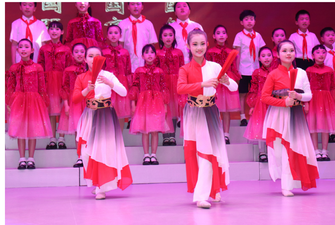
《少年说》情景音诗话