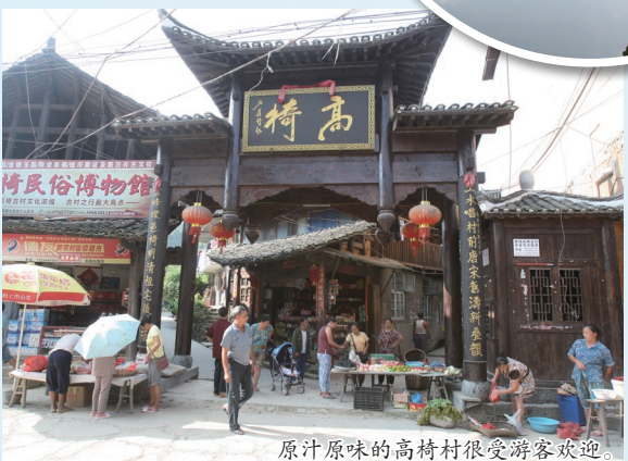
原汁原味的高椅村很受游客欢迎。