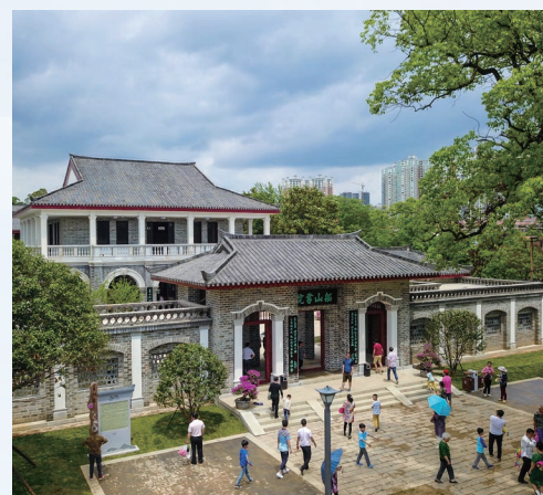
船山书院如今游人如织。

可喜的是，在全域旅游、乡村振兴等国家战略出台后，一些濒临消失的人文景观得到了抢救性的挖掘和发扬光大。