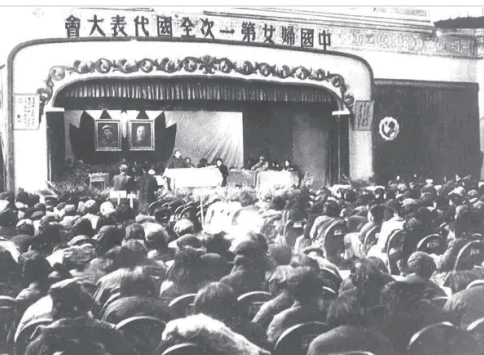
1949年3月24日至4月3日，中国妇女第一次全国代表大会在北平召开。