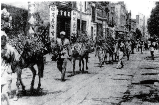
1949年8月5日，中国人民解放军第四野战军第十二兵团的先头部队渡过浏阳河，从小吴门进入长沙城。