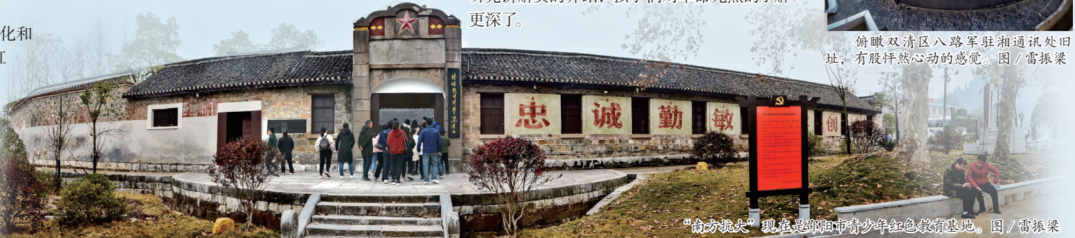
“南方抗大”现在是邵阳市青少年红色教育基地。