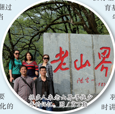
很多人来老山界寻找少年的记忆。