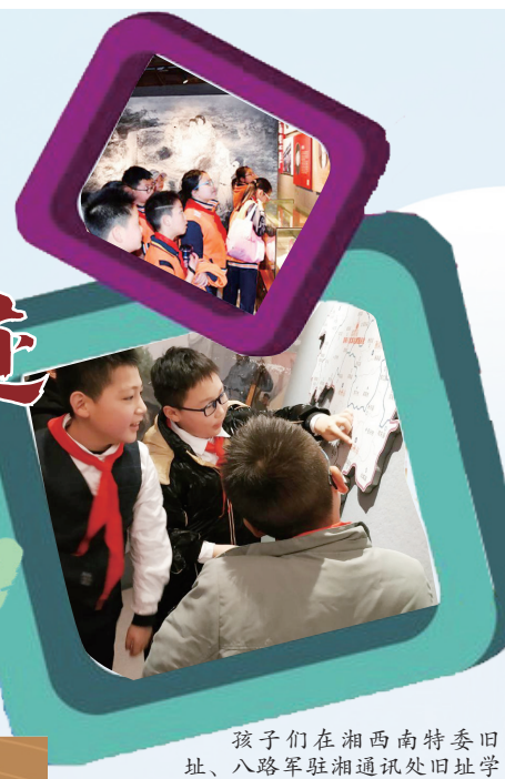
孩子们在湘西南特委旧址、八路军驻湘通讯处旧址学习参观。

邵阳市留存下来的红色史迹有160余处。红军曾三过邵阳市，长征路经新邵、隆回、洞口、武冈、绥宁、城步、新宁，迂回行程2200公里。中国工农红军第七军在武冈的木瓜桥留下的“一个萝卜坑里一枚铜钱”的故事在当地传了一代又一代。贺炳炎将军在鸡公坡战斗中留下了共产党的硬骨头精神永远激励后人奋发图强。今年的五一小长假，来自全国的200多名明星少年来到邵阳，以唱红歌、研学实践、劳动教育等真人情景体验的形式感受邵阳文化和红色旅游。