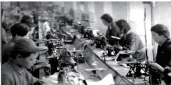
解放区被服厂女工为前方将士制衣。

联谊会成立时，正是武汉解放前夕，国民党白崇禧残部盘踞长沙，部分妇女群众顾虑重重。联谊会一方面组织会员学习政治，秘密组织收听新华社广播，一方面针对妇女的特点和要求，宣传中共的妇女工作方针和政策。