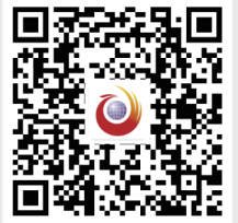
扫一扫，分享精彩内容

什么是家庭养老床位？这张“搬”进家中的养老床位又是如何升级居家老人的养老质量？4月30日，今日女报 / 凤网记者走进长沙市芙蓉区荷花园街道德政园社区“智慧养老体验馆”进行实地探访。